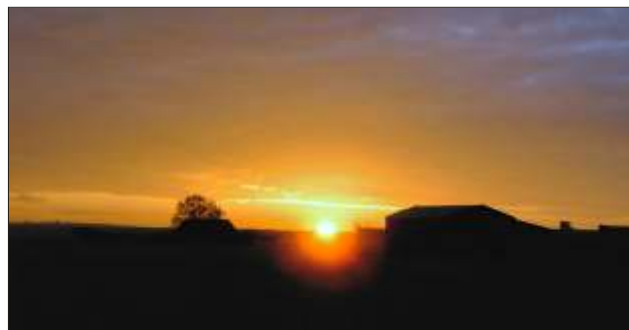
Meget flot solopgang ved afrejsen fra El Burgo Ranero

Det blev sent, vi kom først i seng kl. 21.30.