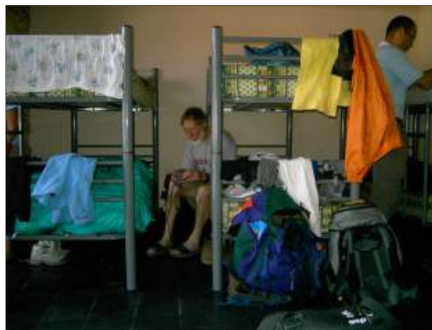
Sovesalen i alberguet i Sarria

Til ro ca. kl. 20.30 med vidt åbne døre til det fri.