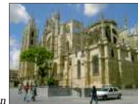
Katedralen i León

Først på aftenen drog et kortvarigt kraftigt tordenvejr hen over byen, men endnu kl. 20.30 skinnede solen ind til os i luksussuiten.