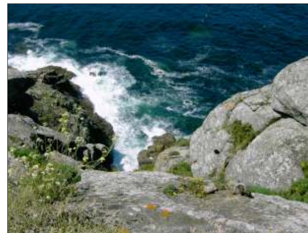
Dønningerne slår højt op på klipperne ved verdens ende: Cap Finisterre

På hjemvejen lidt indkøb i supermarkedet på Plaza do Toural, et hurtigt bad, lidt aftensmad på sengekanten og tidligt til ro. Op i morgen kl. 6