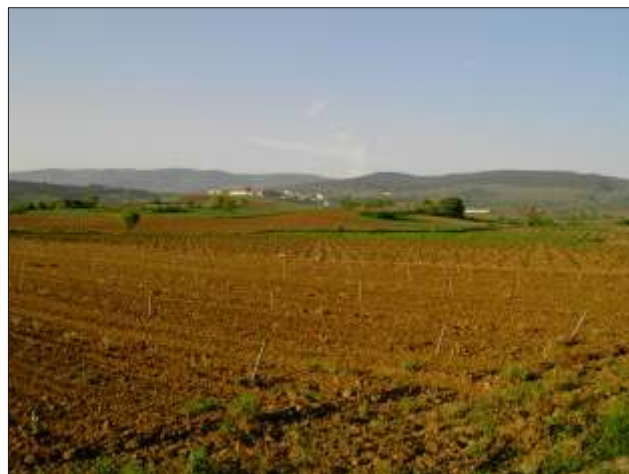
En af de meget store vinmarker i Rioja

Indkøb i "supermarkedet" (landhandlen), besøg i den enkle kirke, dagbogsskrivning og i seng ca. 21.