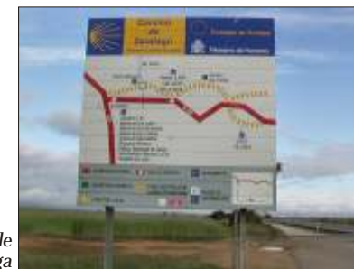
Informationstavle for Astorga

Vi sov ved 20.30-tiden. Nattemperatur: 14°.