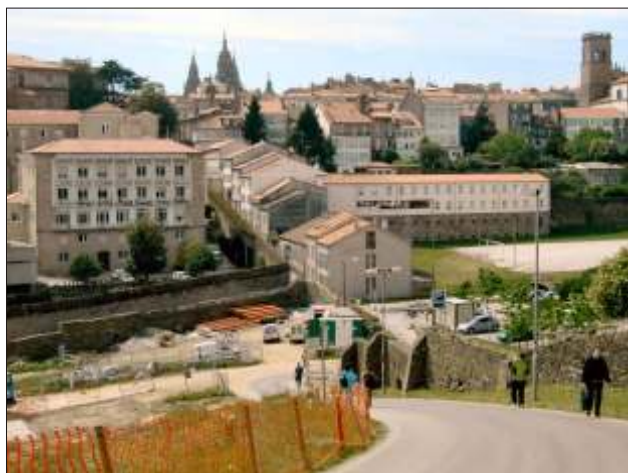
Udsigt fra bakken ved seminariet, kun 10 minutters gang fra centrum