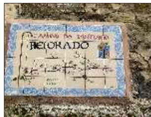
Rutekort på muren

Der var 18 køjer i vores rum. 96 i alt. Inger sov kl. 20. Børge tog et sent bad og sov kl. 20.30.