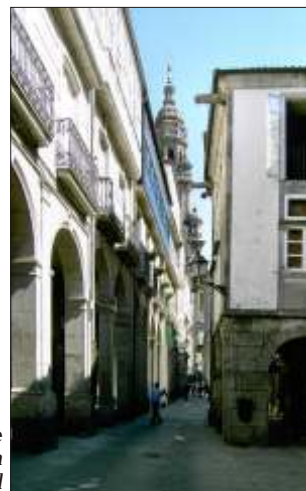
En af de mange hyggelige gader, der fører op til den flotte katedral

Børge fik også en sidste menu i restaurant Franco. Fiskesuppe, stegt kylling og Santiago-kage plus naturligvis rødvin og brød.