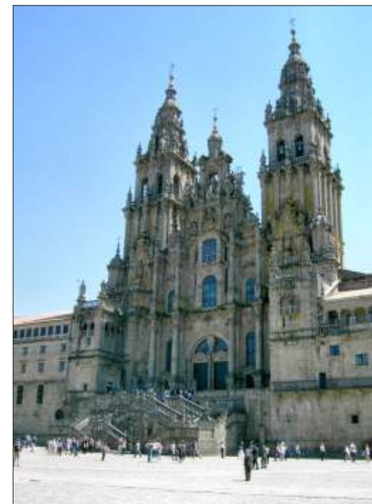
Altid mennesker og liv på pladsen foran den meget smukke katedral i Santiago de Compostela