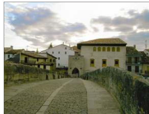
Dronninge broen - Puente la Reina