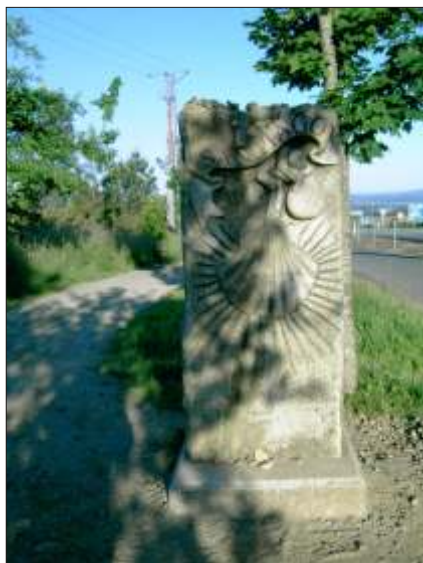
Så nåede vi bygrænsen!

Til køjs for sidste gang på selve turen ved 22-tiden.