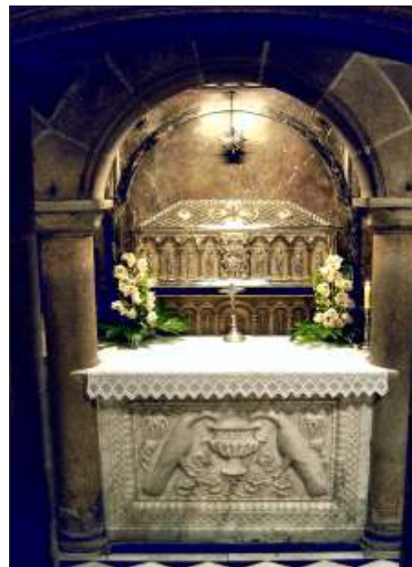
I krypten under katedralen opbevares et sølvskrin med de jordiske levninger af Sankt Jacob

Endnu en rejse er til ende. Endnu en gang har vi fået lov til at besøge ny steder og træffe en masse rare mennesker. Endnu en række begivenhedsrige dage er føjet til mindernes tykke bog. Og der er heldigvis endnu mange ubeskrevne blade i den bog!