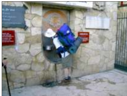
Vand eller vin i hanerne ved kilden i Bodega Irache