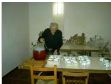
Pateren serverer løgsuppe efter pilgrimsmessen

Og så var det sengetid: 20.30. Inger måtte have tæppe på for at holde varmen.