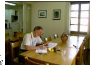
Fast arbejde: Dagbogsskrivning

Nød solens sidste stråler, mens børnene legede på pladsen foran kirken. I seng ved 21.30-tiden.