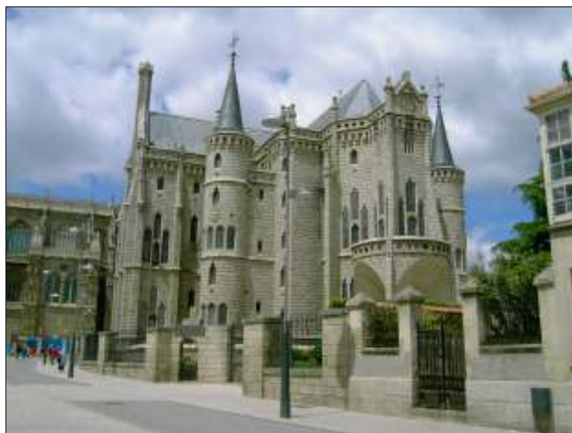
Gaudis hus i Astorga

Som noget helt nyt: pastaparty med efterladte "rør" og noget kød, nogle belgier havde efterladt. Hertil tonicvand (efterladt) og dåseøl (købt). Det mættede dejligt. Nød endnu en gang varmen på gangen, inden vi pakkede rygsæk og gik til ro kl. 20.15.