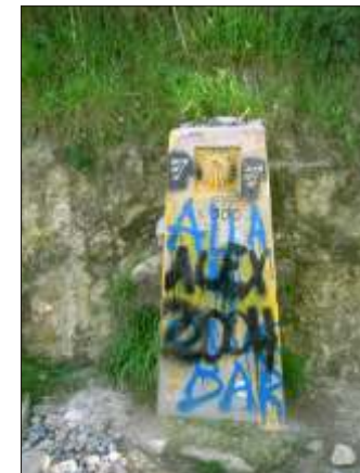
Nu kun 100 kilometer til Santiago!

Hjem og skrive dagbog og pakke rygsæk til morgendagen. Til køjs kl. 21.50.