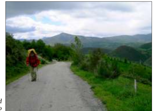
På vej mod O Cebreiro

Et let aftensmåltid på sengekanten sluttede en god dag.