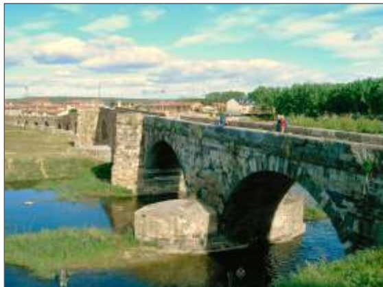
Den lange Puente de Órbigo for Hospital de Órbigo

Børge fik også sendt e-mails om eftermiddagen.