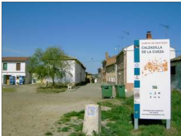
Midt ude på Mesetaen: et pilgrimsherberg med swimming pool

Børge skejdede ud med et glas cigales i baren. "Kontoret" var låst. Der var kun soverummet at opholde sig i, så vi gik i seng kl. 20 - og sov godt.