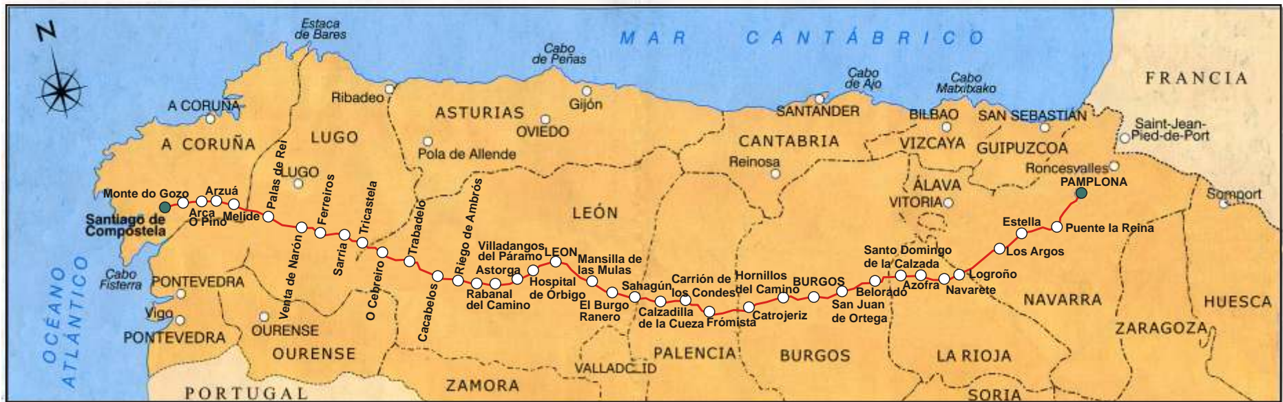
Rutekort med overnatningsbyer