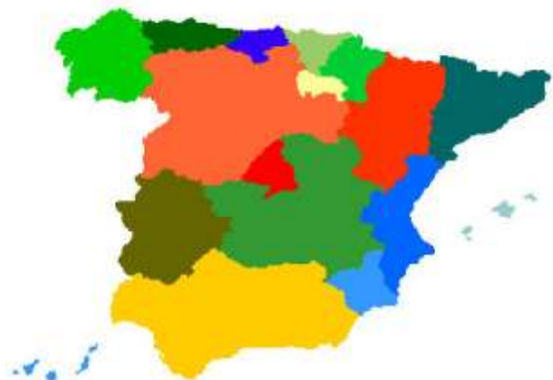
Regioner i Spanien