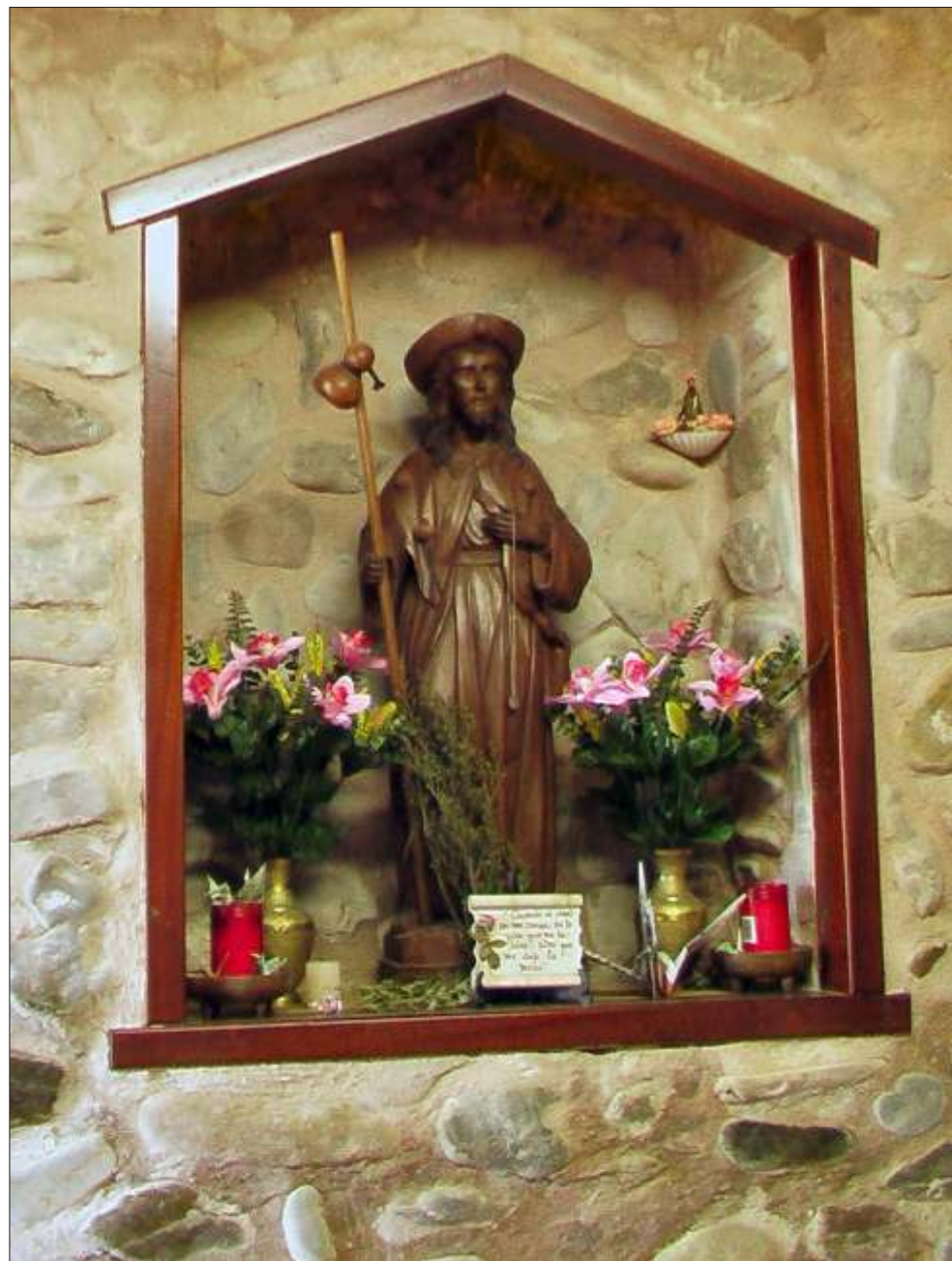
Relief i Albergue "Quatro Cantone" i Belorado