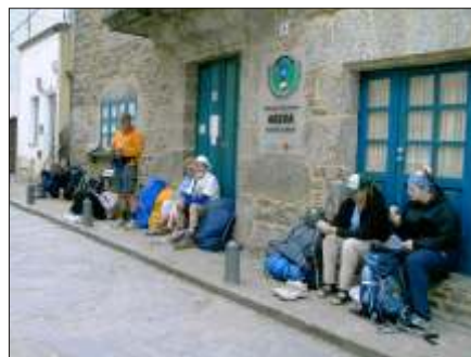
2 timers venten før vi kunne komme ind på herberget i Arzua

Senere blev der stillet an til rockkoncert på plazaen. Den begyndte kl. 21 og varede til kl. 3! Inger var glad for sine ørepropper.